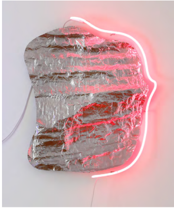
Franck Miltgen, Trace VIII , 2018 Aluminium, resin on fibreglas, neon tube 80 x 64 x 11 cm (31,5 x 25,2 x 4,3 in)