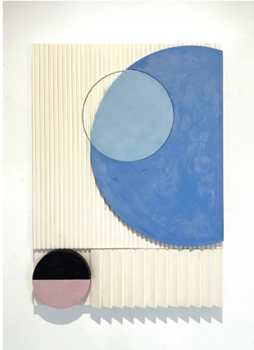
Feipel & Bechameil, Untitled (bleu) , 2019 Acrylic resin, robotic motor 143 x 103 x 9 cm (56.3 x 40.55 x 3.54 in)