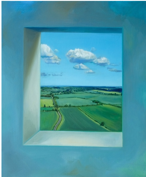
Anne Mélan, The Fields , 2025 Oil on canvas 60 x 50 cm (23 5/8 x 19 3/4 in)

Zidoun-Bossuyt présente pour la première fois dans son espace parisien une exposition collective réunissant 4 artistes luxembourgeois.